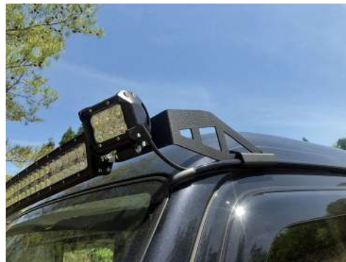
DA64系エブリイへの取付状態