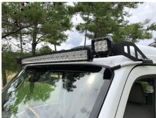
DA17系エブリイへの取付状態