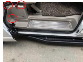
⑥後部席の室内のステップ部の樹脂製トリムを外します。