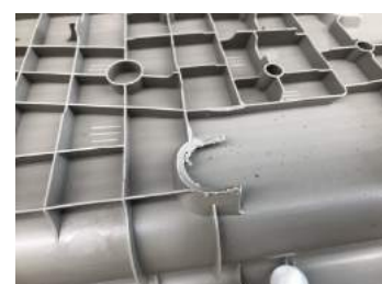
⑧樹脂パネルを元に戻す前に、ボルト固定の際に利用したクリップ留め穴の部分のクリップを外しカッターナイフなどで、クリップ留めのツメ部分を切り取ります。