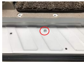
⑦赤マルの所のクリップ留め用の穴を利用して、中央用のブラケットを固定します。