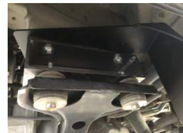
③エンジンメンバーサイドの後ろ側のボルトを外してフロント用のブラケットを差し込んで仮止めします。（長穴の方です）この時まで前側のボルトは外さないでください。