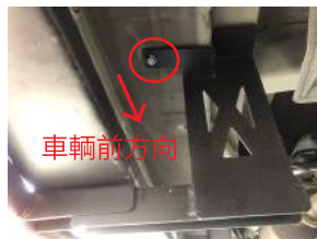
⑦赤マルの所の純正ボルトを外し、付属のM6ボルトと交換します。

裏側にボルトが突き出るので、そのボルトを利用してブラケットを挟み込みナットで固定します。※締めすぎるとパワースライド用モーター部品が破損するので注意。