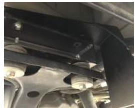
④後ろ側を仮止めしたら、前側のボルトを外します。エアクリーナーのホースを固定しているボルトも外します。