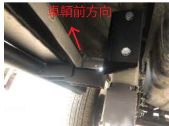
①リア側のブラケットを、リアアームフレーム部の穴に当て板を利用して固定します。（リフトアップブロック装着時は当て板は使用しません）